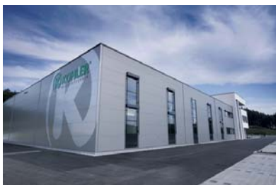
Das neue Firmengebäude: mit direkter Anbindung an die A 98

Kohler Instrumente stehen für Innovation, Qualität und Präzision – Werte, die mit dem neuen Firmengebäude ihren Ausdruck finden. Mit dieser Investition als Antwort des Familienunternehmens auf den Erfolgskurs der letzten 30 Jahre wurde die Basis für eine wirtschaftliche Produktion, für effiziente Arbeitsabläufe und eine leistungsfähige Warenwirtschaft gelegt. Über 4.000 Instrumente und zahlreiche OEM-Produkte für namhafte Hersteller der Dentalbranche werden am Standort Deutschland entwickelt, gefertigt und – angepasst an die unterschiedliche Anatomie der Menschen – in über 80 Länder der Welt geliefert.