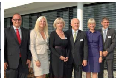
Stehen für Erfolg durch Kompetenz: die zwei Generationen des Familienunternehmens